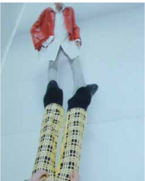
FILM: AXEL LOKRANTZ MÄNSON & JOSEF RUONA