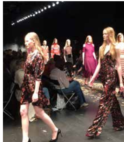
HOUSE OF DAGMAR