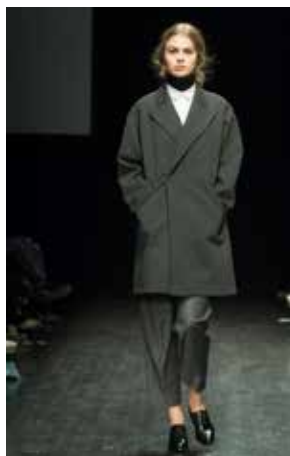
EA 4 TH

Ytterligare en faktor som särskiljer årets utvalda är den stora andelen herrmärken samt märken med såväl dam- som herrinriktning.