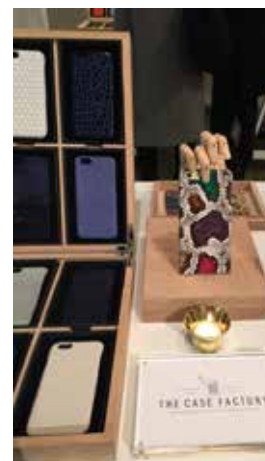
THE CASE FACTORY