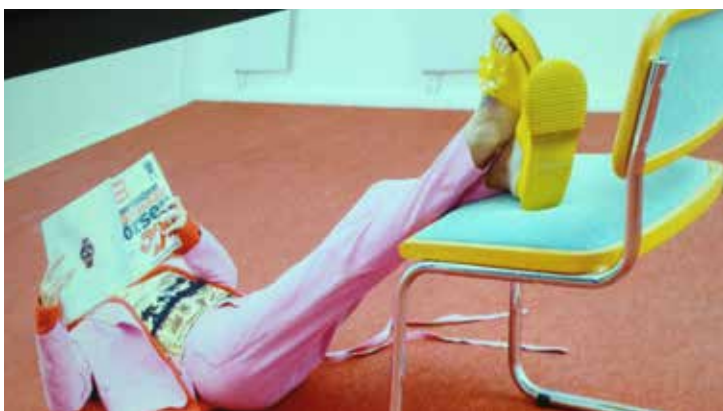
FILM: KRISTOFER GULLARD LINDGREN & TOMAS MÖLLER