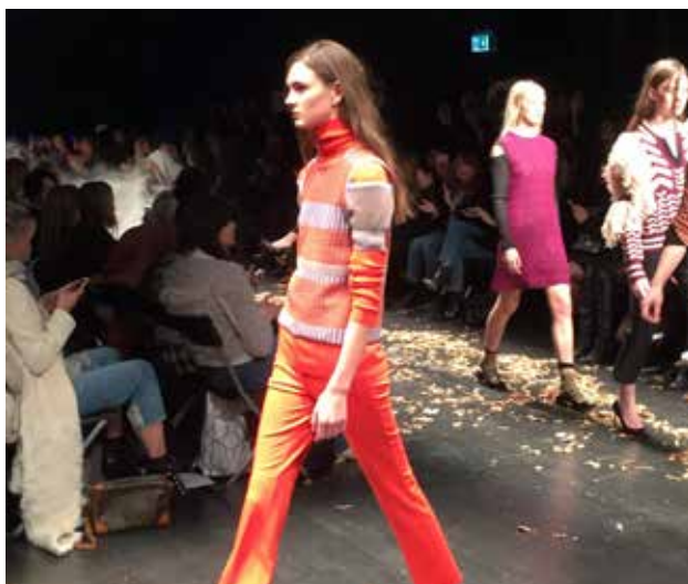
HOUSE OF DAGMAR

Kollektionen kombinerades av fint och grovstickat, öppna ryggar, djupa v-ringningar, mjuka linjer med en kontrasterar skarpa skärningar. Vi ser nyckelplagg såsom penn kjolen, polo tröjan, kick flare byxor och håriga rockar. En bred och kvinnligt sensuell kollektion där kontraster mellan klänningarnas design, med inspiration från neglisher, som kombineras med tunga klassiska kappor eller jägar inspirerade accessoarer. Även de olika materialen bar bredd. Håriga mohairer, blankt läder och skimrande satin. Färgskalan går i tweedfärger såsom brunt och grönt, kalla pasteller med pendanger av starkt orange och rött.