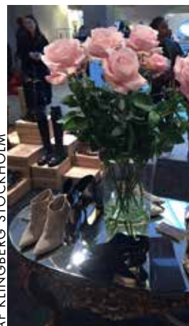
AF KLINGBERG STOCKHOLM